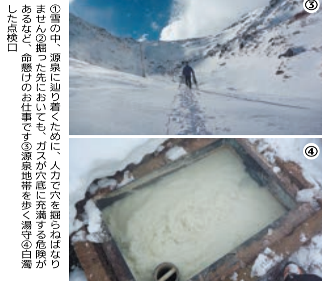
①雪の中、源泉に辿り着くために、人力で穴を掘らねばなりません②掘った先においても、ガスが穴底に充満する危険があるなど、命懸けのお仕事です③源泉地帯を歩く湯守④白濁した点検口