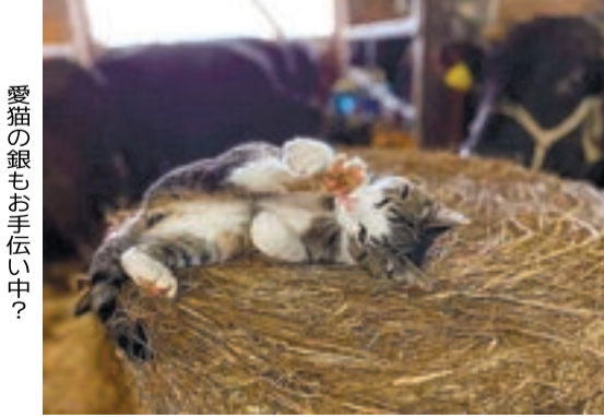
愛猫の銀もお手伝い中?