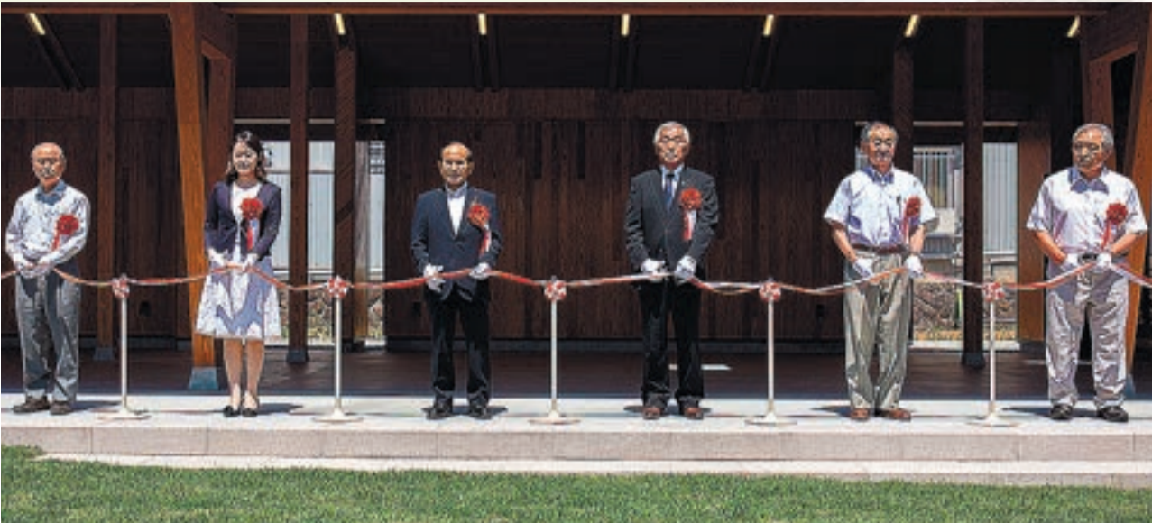
⑤テープカットで完成を祝った岳温泉交流広場の竣工式⑥竣工式で挨拶するわれらが二瓶会長